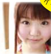
藤波心氏 (タレント)